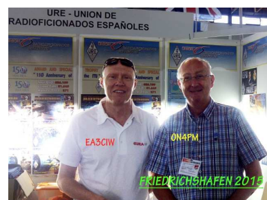
EA3CIW y ON4PM de visita...