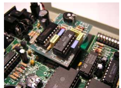
Packet con squelch abierto.